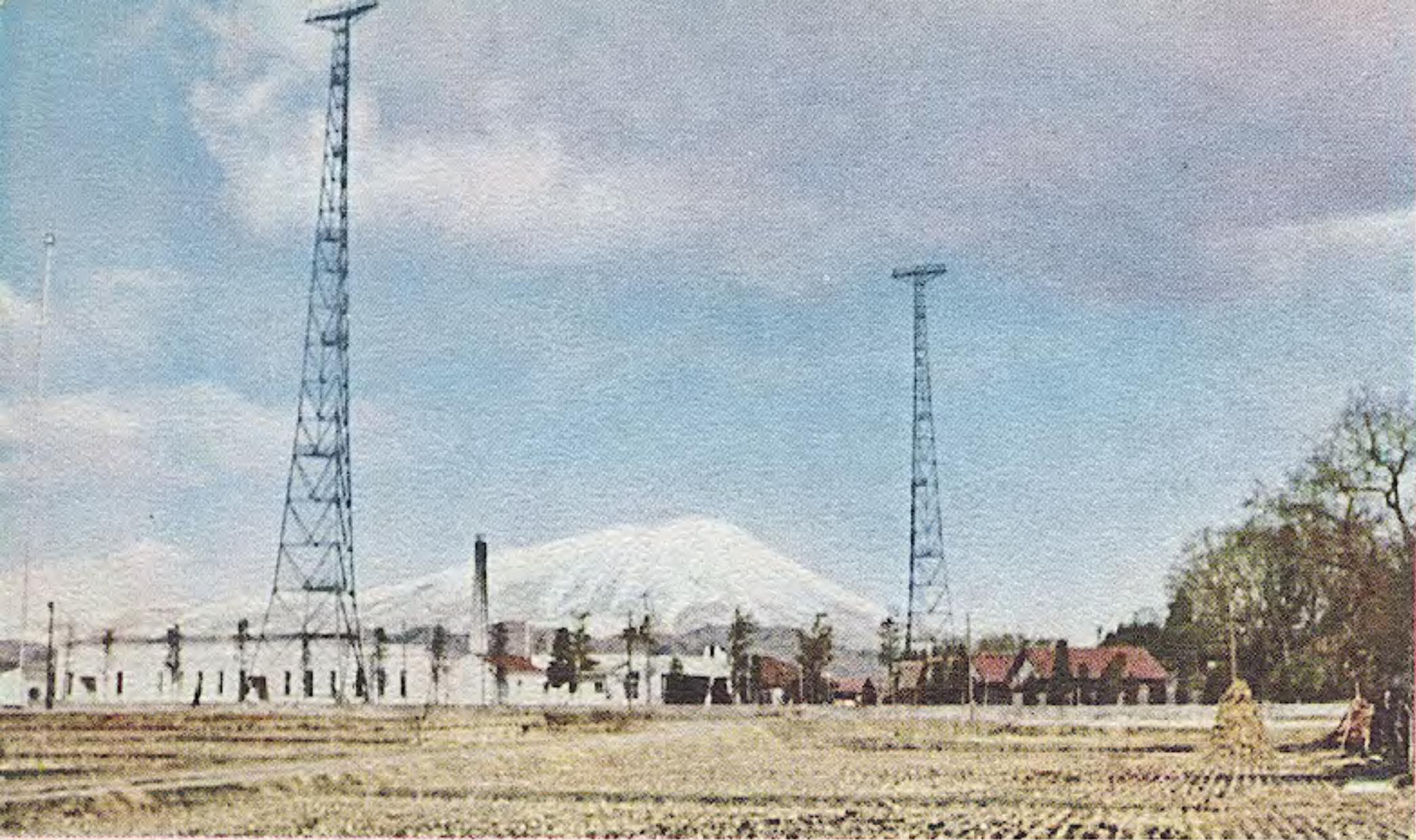
盛岡放送局と岩手山

10キロ放送を開始したQ Gの アンテナが高さを競う如くて はあるが、大自然の山容には 遠く及ばない。