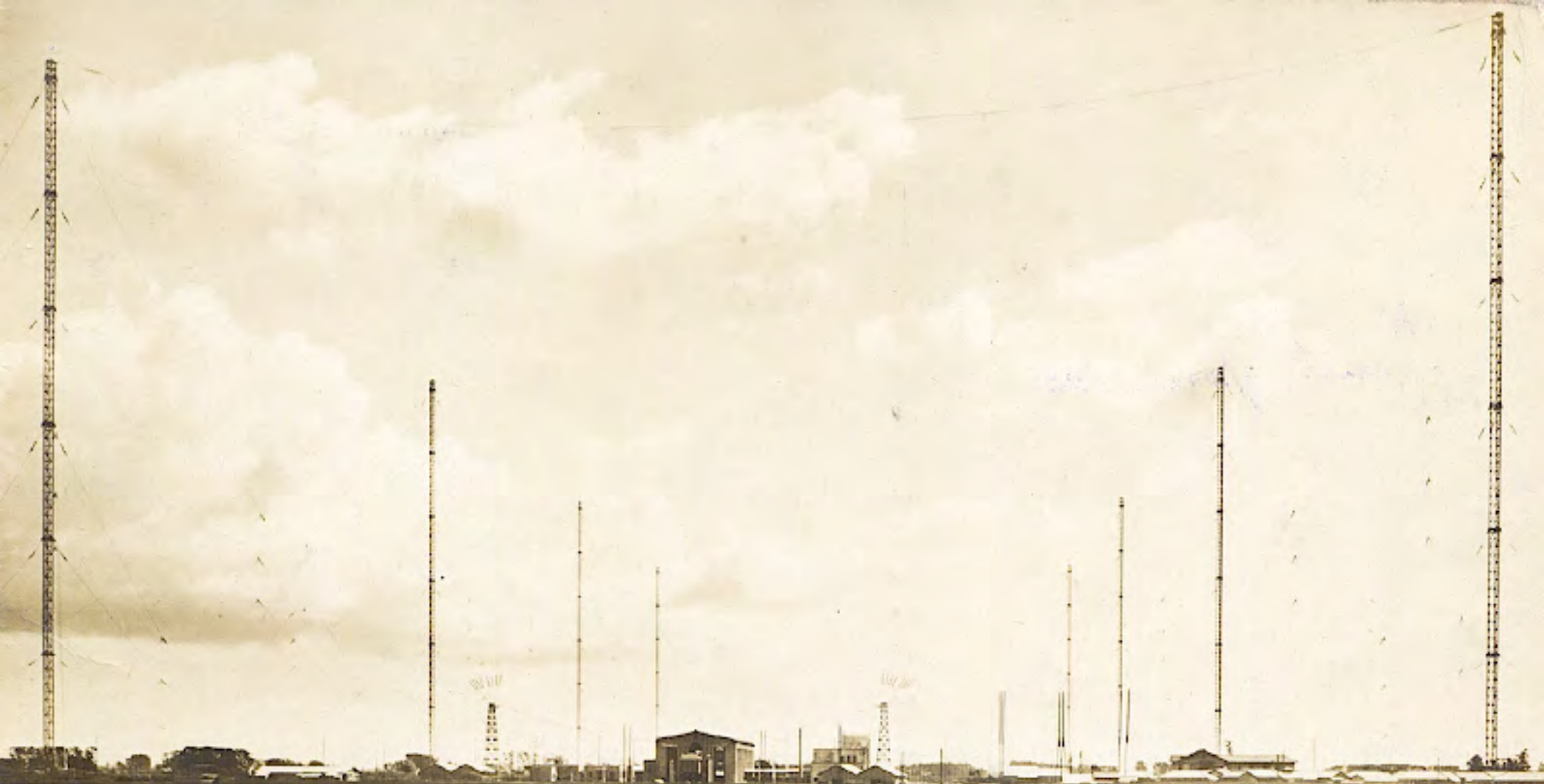
General view of Yosami Transmitting Station. 景全所信送美佐依(下縣知愛)