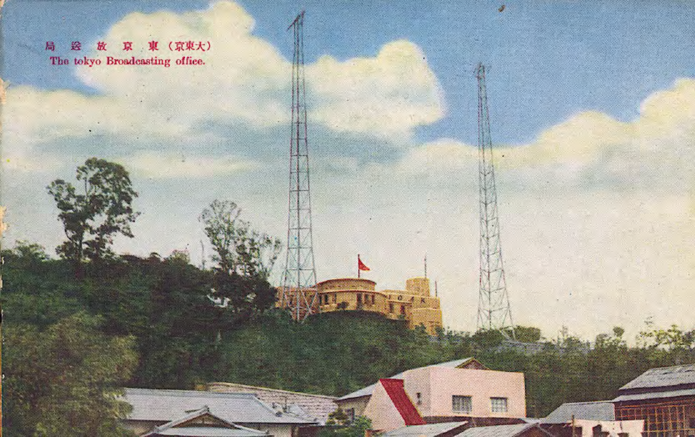
局 送 放 京 東 (京 東 大) The Tokyo Broadcasting office.