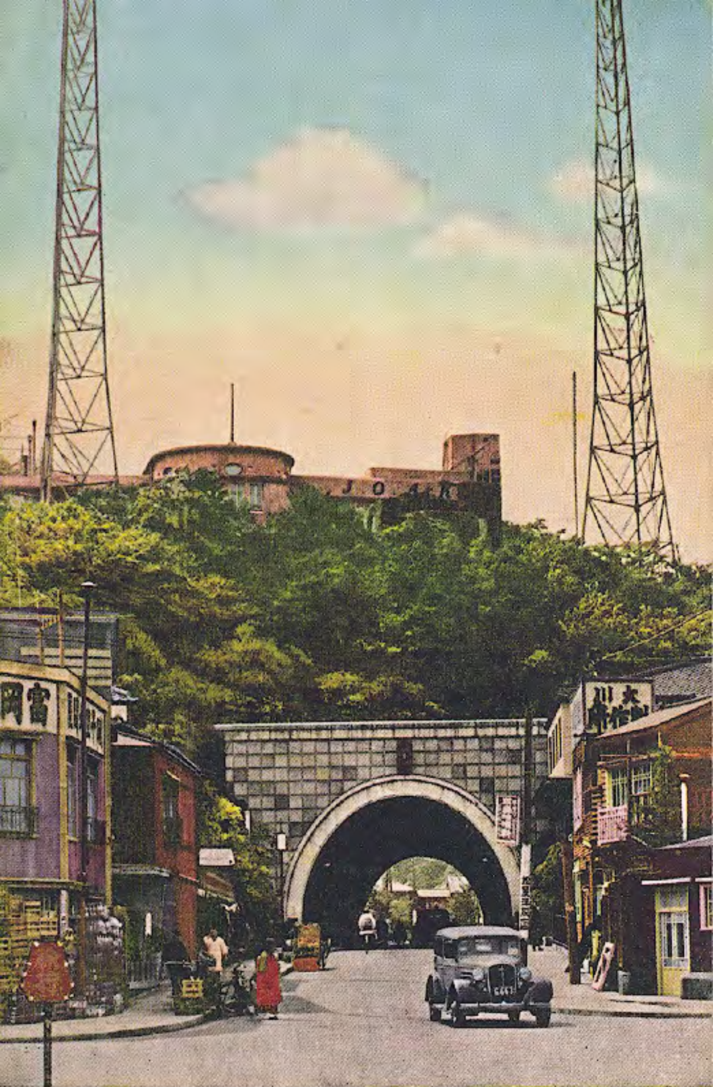
Tokyo Broadcasting Station, (Greater Tokyo) 局送放央中京東山宕愛芝(京東大)