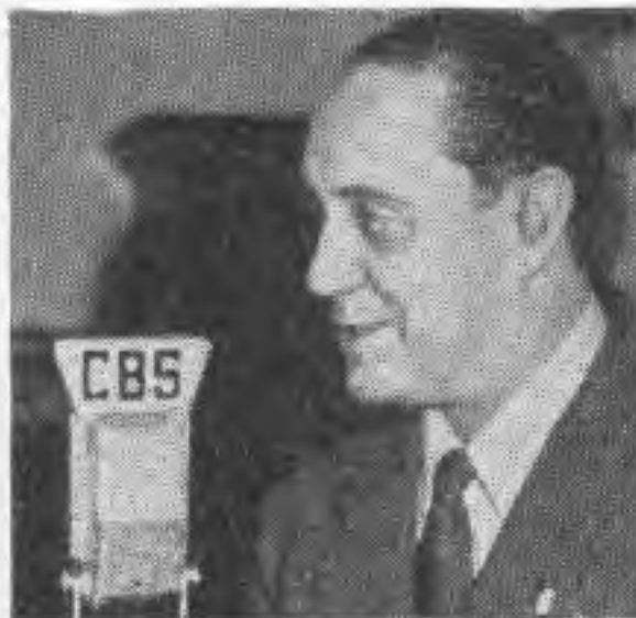
ROBERTO UNANUE , conocido autor y periodista argentino. Ha publicado más de 300 artículos en revistas argentinas. (Los lunes.)