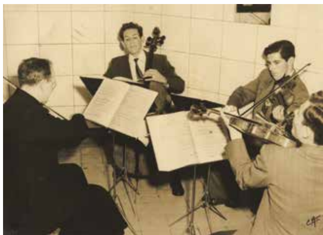
Concierto del cuarteto Lenhard transmitido desde los estudios de la Radio Universitaria.