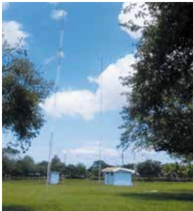
Torre de transmisión de la 870 UCR en Liberia, Guanacaste.

Y por supuesto, la radio en diferentes circunstancias ha tenido un protagonismo en las comunidades, desde cosas tan simples como pasar recados, recordar las actividades religiosas y culturales de un pueblo hasta informar sobre situaciones de emergencia, desastres naturales y conflictos armados.