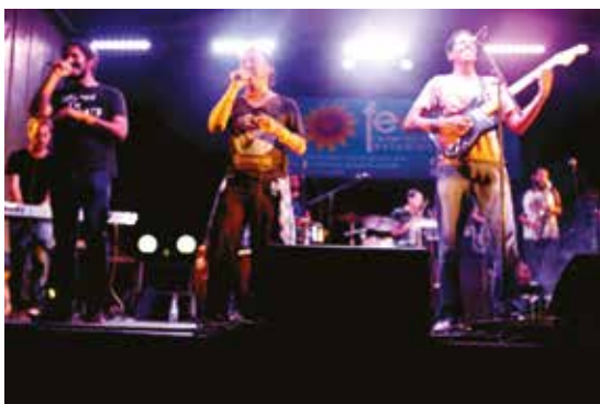
La agrupación Sonámbulo se ha presentado en varios conciertos organizados por la radio.

Por eso, cuando se piensa en la música nacional de aproximadamente las últimas dos décadas, especialmente en géneros como el rock, la trova, el reggae, el ska o el punk, también vale la pena recordar el papel de la radio y los intentos que desde la UCR se hacen para impulsar estas manifestaciones culturales, que en gran parte, surgen desde la misma juventud, principal audiencia de Radio U.