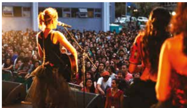
La agrupación nacional Passiflora durante el concierto para conmemorar el 18 aniversario de Radio U.

Varios programas se volvieron realidad mediante alianzas con instituciones y entidades dentro y fuera de la UCR. El micro programa “Ciencia y Tecnología” que se dedica a la divulgación científica, se realiza con el apoyo de la Fundación CIENTEC, mientras que “En Escena” se produce junto a la Escuela de Artes Dramáticas.