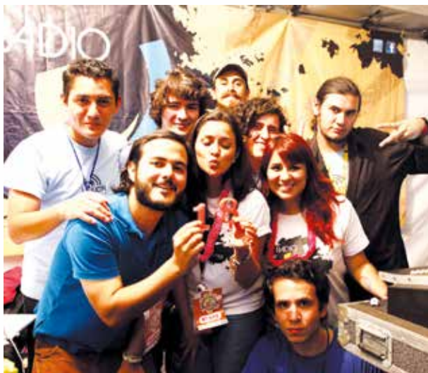
El equipo de Radio U celebra los 18 años de la emisora.

se pueda escuchar opinión, análisis y crítica, junto a programas musicales con gente joven reflexionando y conversando al aire. Todavía quedan muchas más generaciones de jóvenes que tienen este espacio para dar sus primeros pasos en la radio, hacer escuchar su voz y ayudar al impulso de Radio U hacia más décadas de vida.