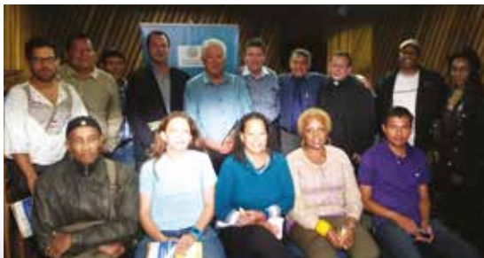
Candidatos y miembros de las organizaciones sociales posaron juntos al final de la transmisión del programa “De cara a la Gente”.

Hemos introducido un proyecto del ley que busca declarar al país libre de estos cultivos transgénicos. Primero si apoyarían esta ley que declara al país libre de transgénicos y en un segundo momento, aprobando un decreto, por ejemplo, que obligue al etiquetado de los alimentos, que es algo que a través de esta discusión nos hemos dado cuenta, bueno ya más o menos sabíamos, que lo que estamos comiendo en nuestra mesa viene importado. La mayoría es genéticamente modificado.