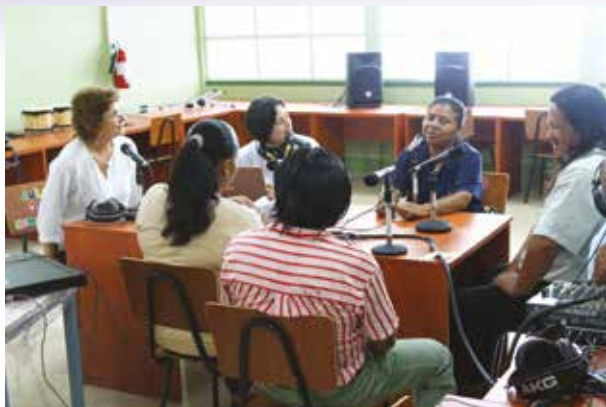
Transmisión del programa Desayunos de Radio Universidad desde la comunidad indígena de Salitre en Buenos Aires de Puntarenas, en setiembre del 2014.